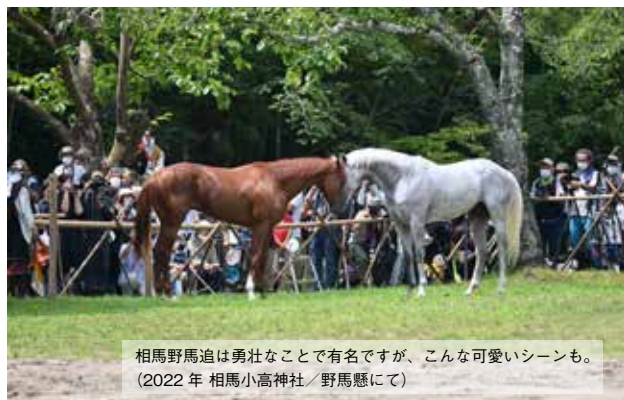
相馬野馬追は勇壮なことで有名ですが、こんな可愛いシーンも。(2022年 相馬小高神社/野馬懸にて)

その年の相馬野馬追が7月に規模を縮小して開催されたのち、8月9日に第1陣の9頭が南相馬市から日高町の牧場に到着。町長自ら出迎えました。その後も順次受け入れが進み、2012年2月1日の第5陣8頭まで計52頭が避難しました。受け入れ費用は、日高町が負担。